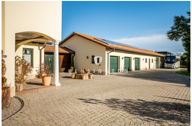
Kensington_KSH_340_Zugang zum Garten_Bassum