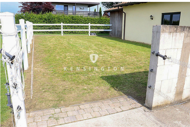
Stallbereich und Mistplatte hinten