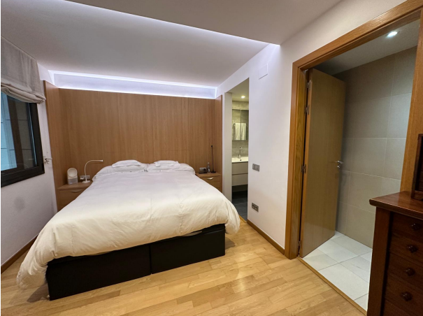
WhatsApp Image 2024-06-28 at 13.14.29 (4)