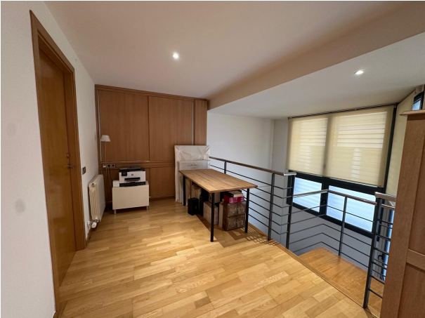
WhatsApp Image 2024-06-28 at 13.14.29 (6)