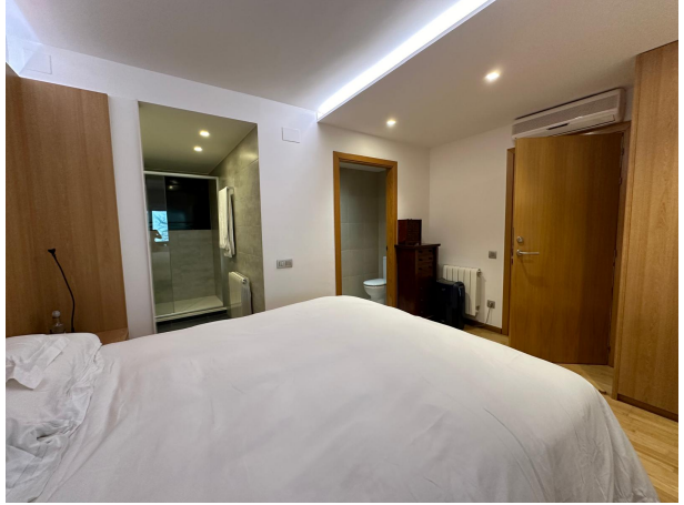
WhatsApp Image 2024-06-28 at 13.14.29 (3)