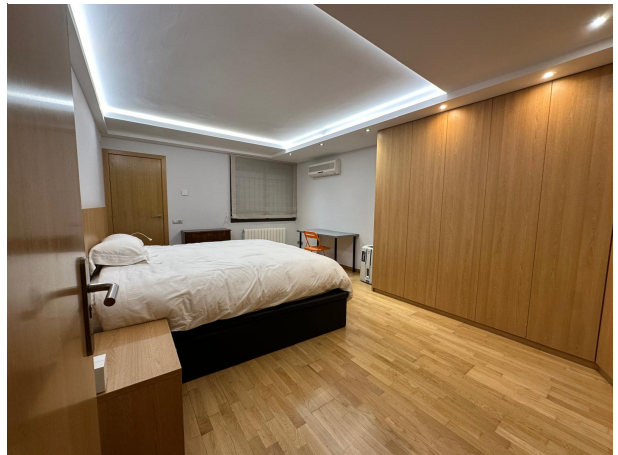
WhatsApp Image 2024-06-28 at 13.14.29 (11)