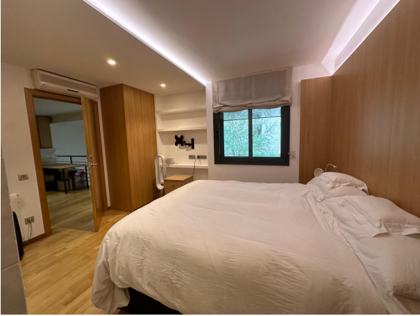
WhatsApp Image 2024-06-28 at 13.14.29 (2)