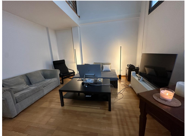
WhatsApp Image 2024-06-28 at 13.14.29 (9)