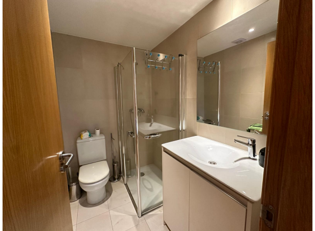
WhatsApp Image 2024-06-28 at 13.14.29 (5)