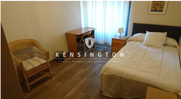
Captura de pantalla 2023-10-23 121612