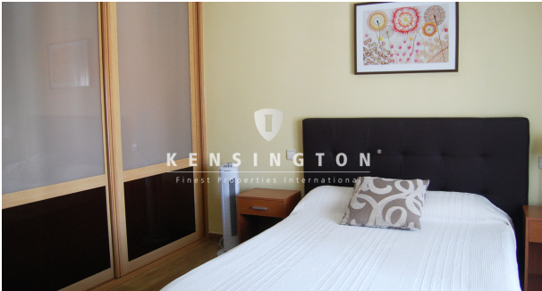
Captura de pantalla 2023-10-23 121530