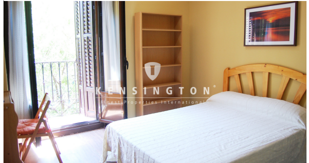
Captura de pantalla 2023-10-23 121547