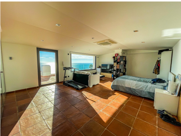
WhatsApp Image 2024-05-23 at 18.20.36 (1)