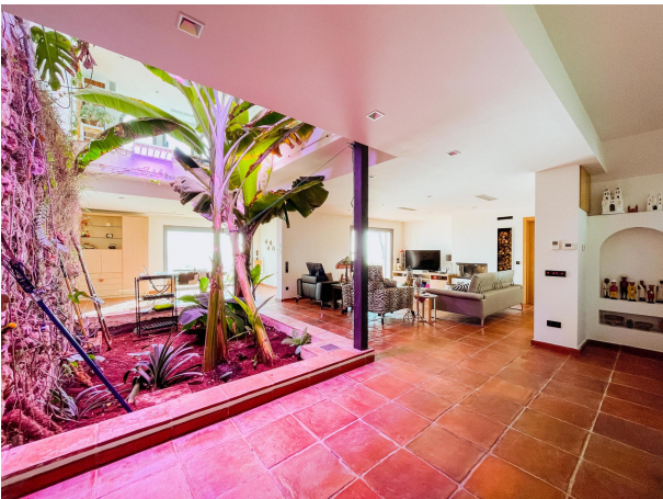
WhatsApp Image 2024-05-23 at 18.20.35