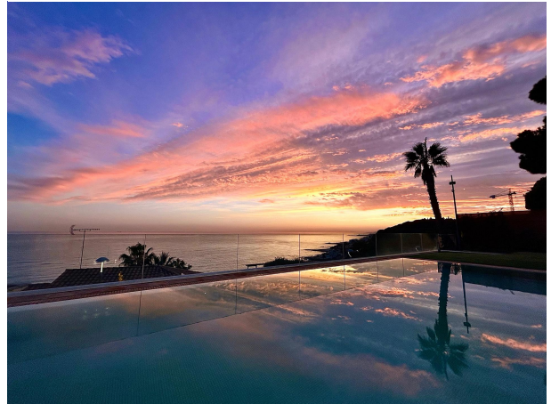
WhatsApp Image 2024-05-23 at 18.20.35 (1)