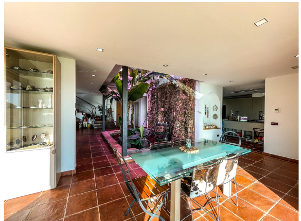
WhatsApp Image 2024-05-23 at 18.20.37