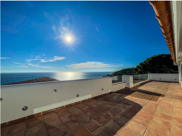
WhatsApp Image 2024-05-23 at 18.20.39 (2)