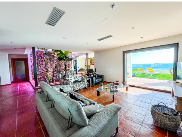
WhatsApp Image 2024-05-23 at 18.20.34